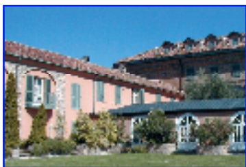
Locanda del Sant'Uffizio Strada del Sant'Uffizio, 1- Cioccaro di Penango (AT) tel. 0141.916292